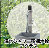
温水シャワー不凍水栓柱 アクラス

光合金製作所は創業以来70年にわたり水道を凍結から守る不凍水抜栓とその周辺機器の研究開発を一筋に行っておりまいた。