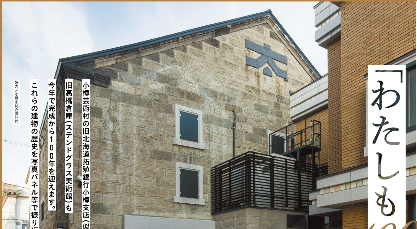
小樽芸術村の旧北海道拓殖銀行小樽支店(似鳥美術館)と