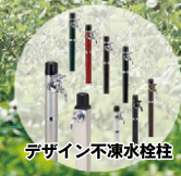
デザイン不凍水栓柱