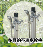
多目的不凍水栓柱